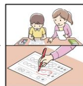
《Step2》 採点をして、できていないところだけを保護者と復習