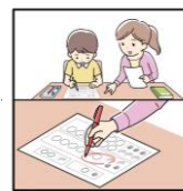
《Step2》 採点をして、できていないところだけを保護者と復習