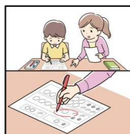
《Step2》 採点をして、できていない ところだけを保護者と復習