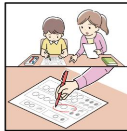
《Step2》 採点をして、できていないところだけを保護者と復習